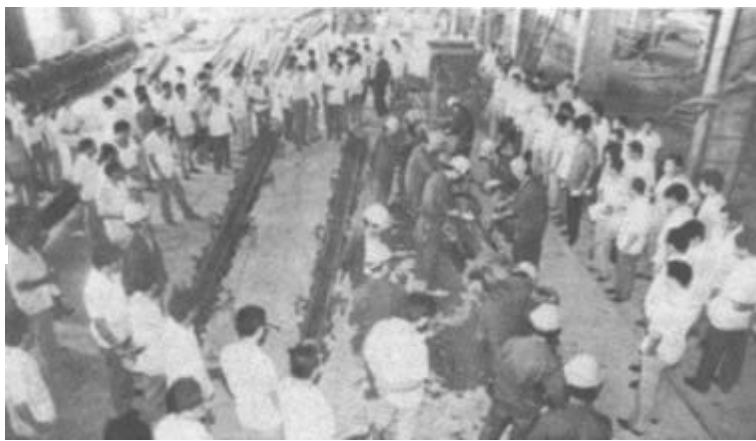
图为与会代表在东营水泥制品厂参观。

垦利讯 垦利县商业局在第二轮承包中,拓宽经营渠道,开展优质服务,一举甩掉了亏损的帽子。到7月底,实现利润35.8万元,是去年同期的31倍。